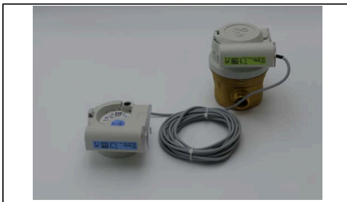
Kit IZAR BE PULSE + IZAR PULSE i + ALTAIR V4 + IZAR RC i