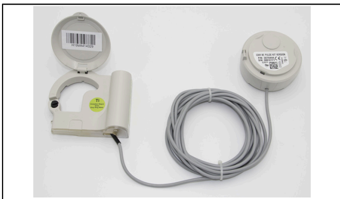
Kit IZAR BE PULSE + IZAR PULSE i

IZAR BE PULSE ist auch als werkseitig montierter Bausatz mit einem IZAR PULSE i erhältlich. Die Kabellänge beträgt zwischen 4.95 und 5 m (aufgrund von Fertigungstoleranzen). Das Kit besitzt Schutzklasse IP 68 (Schutz gegen dauerndes Untertauchen).