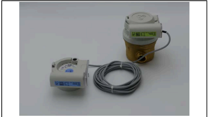
Kit IZAR BE PULSE + IZAR PULSE i + ALTAIR V4 + IZAR RC i