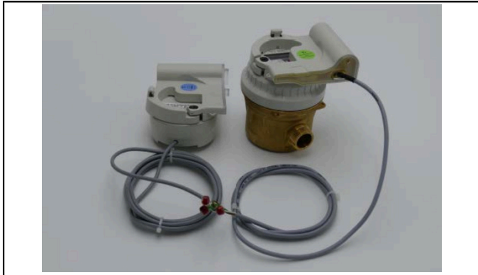
IZAR BE PULSE + IZAR RC i + ALTAIR V4 + IZAR PULSE i