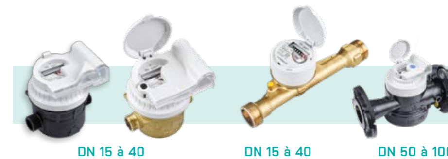
DN 15 à 40