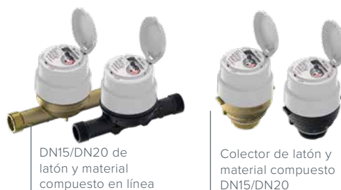
DN15/DN20 de latón y material compuesto en línea

La historia de éxito de ALTAIR continúa con un nuevo diseño de producto que tiene un impacto decisivo en el medio ambiente. La nueva generación ALTAIR V5 le proporciona la mejor tecnología volumétrica: un rendimiento metrológico excelente y una fiabilidad de medición a largo plazo. Apto para los entornos más exigentes. Para una gestión eficiente del agua. Para reducir el agua no contabilizada. Para conservar uno de los recursos naturales más preciados del mundo: el agua.